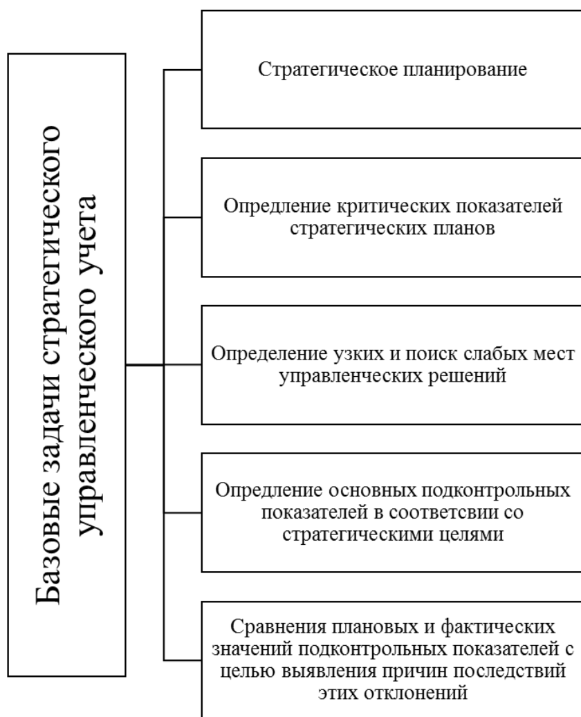
Рисунок 2 – Основные задачи стратегического управленческого учета

Необходимость разработки самостоятельной концепции стратегического управленческого учета финансовых потоков организации в рамках стратегического управленческого учета обусловлена тем неоспоримым фактом, что практически все управленческие решения могут быть реализованы только при условии их надлежащего финансирования, будь то модернизация производства, переподготовка персонала или разработка новых продуктов.